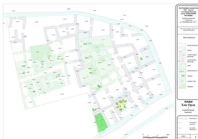
4-сызба – Хан Ордасы төртінші құрылыс қабатының жобасы