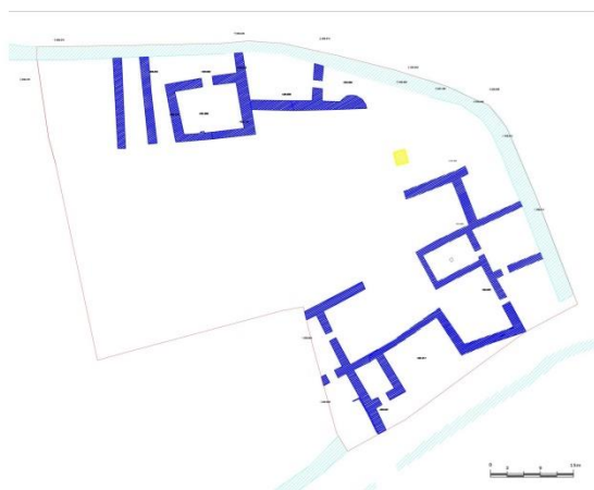
3-сызба – Хан Ордасы үшінші құрылыс қабатының жобасы

Түркістан өңірін жылдар бойы зерттеген М. Тұяқбаевтің зерттеулеріне сүйенсек, кейінгі ортағасырдың аяғына қарай XVII–XVIII ғасырларда керамика өндірісі тоқырауға ұшырай бастағанын көре аламыз. Осы кезеңнің керамикаларының ішкі беттері бұлыңғыр тәрізді мұнартқан ақ, көгілдір түсті бояулармен және түссіз шыңылтырлармен көмкерілген. Сырт жағынан ақ түсті ангобпен боялып, қара сырмен ернеу жиектері мен ішкі табан бөлігіне айналдырыла сызықтар түсіріліп, екі сызық ортасы гүл дестелері тәрізді өрнектермен безендірілген, тұтастай немесе жоғары бөліктері сырланып, беттері аздап шыңылтырланған [9, 132–133-с.]. Осындай өрнектеу мәнеріне ие керамика бөліктері Күлтөбе қалажұртының цитадель және рабат бөліктерінен табылса [10, 72–110-с.], ұқсастары Саухым-Ата, Төркүл-Бабайқорған, Төрткүл-II, Қарашық қалажұрттарында жүргізілген қазба жұмысы барысында табылған [9, 167–182-с.].