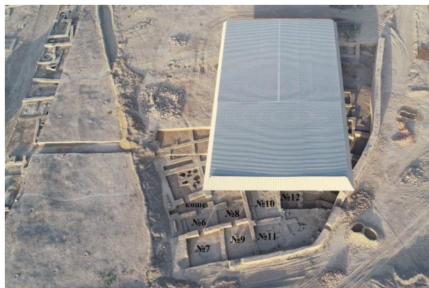
4-сурет – Қазба алаңының шығыс бағыттан әуеден көрінісі

2020 жылы Хан Ордасында жүргізілген қазба жұмыстарының нәтижесі