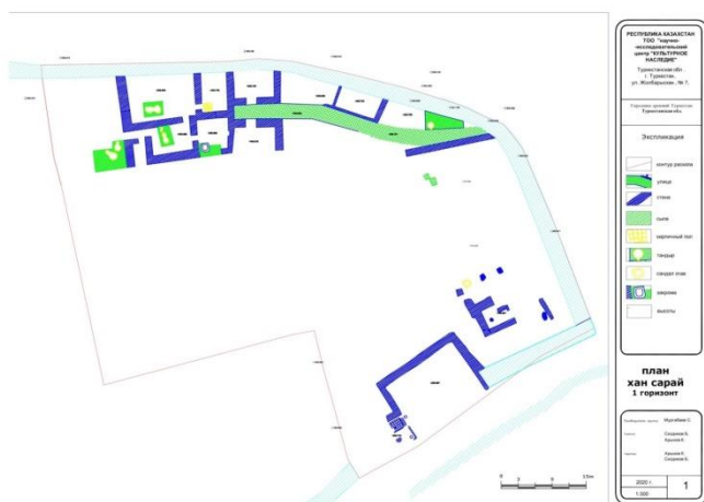
1-сызба – Хан Ордасы бірінші құрылыс қабатының жобасы

Хан Ордасында жүргізілген археологиялық қазба жұмыстары барысында үшінші құрылыс қабатына жататын құрылыс нысандар, екінші құрылыс қабатына жататын нысандардың құрлымы өзгеріссіз қайталанып, олардың екінші едені негізінде ажыратылды. Жоғарыда айтып өткеніміздей аталмыш кешендегі құрылыс нысандар негізгі құрлымын жоғалтпай, тек қосымша жөндеулер мен едендердің негізінде ажыратылуда. Осы себепке байланысты, Хан Ордасында жүргізілген археологиялық қазба жұмыстары нәтижесінде екінші және үшінші құрылыс қабаттарына жататын нысандардың өзгеріссіз бір-бірінің жалғасы болып табылатындығы, олардың тек едендер бойынша ажыратылатындығы анықталды. Себебі, М.Тұяқбаев Хан Ордасында 2008 және 2013 жылдары жүргізген қазба жұмыстары барысында аталмыш қабаттардың тек едендер бойынша ажыратылатындығын дәлелдеп, хронологиясын белгілеген. Маусымдық далалық зерттеу жұмыстарымыздың нәтижесінде екінші құрылыс қабатының екінші еденінен жинақталған заттай деректерге салыстырмалы талдау жасай отырып, аталмыш қабаттың XVIII ғасырдың соңына жататындығы анықталды. Хан Ордасының үшінші құрылыс қабаты 3-4 белдеулерде (ярус) орналасқан (3-сызба).