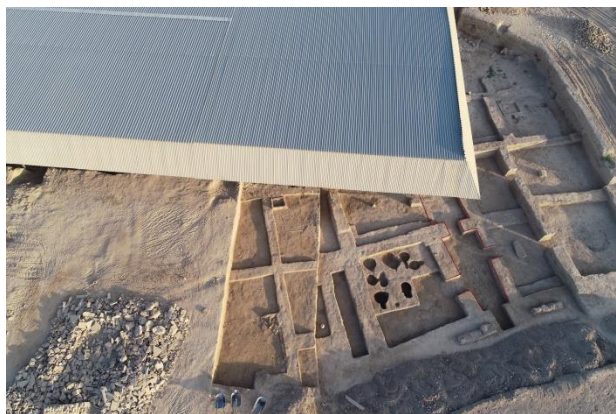
3-сурет – Қазба алаңының оңтүстік бағыттан әуеден көрінісі