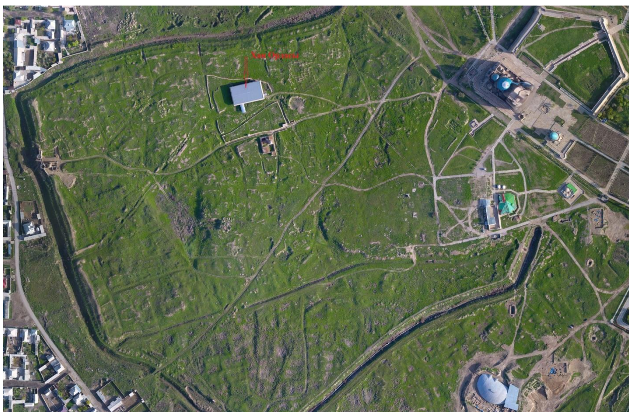
2-сурет – Ескі Түркістан қаласының әуеден көрінісі