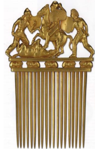
2-resim – Soloha kurganından ele geçen altın tarağın üzerinde yer alan hancer tasviri [26, s. 35].

Tasvirli eserler üzerinde mızrak. Saldırı silahları arasında yer almakta olan mızrak, savaş ve av sırasında kullanılan uzun, düzgün bir sap ve sivri bir uç ile oluşturulmuş silah tipidir. Kurgan kazılarında ele geçen tasvirli eserler bu tür silah konusunda önemli bilgiler vermektedir.