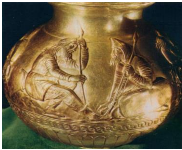
4-resim – Kul – Oba mezarlığındaki 11 Nr.lı kurganından ele geçen altın vazo [3, s. 228].

Yukarıda bahsedilen eserler üzerinde detaylı bil şekilde duracak Soloha kurganından çıkartılan altın tarağın üzerinde savaş sahnesi tasvir edilmiştir, bu sahnede elinde mızrağı olan atlı savaşçının yaya savaşçıyla mücadele sahnesi betimlenmiştir [8, s. 35]. Kul-Oba mezarlığında yer alan 48 Nr.lı kurgandan çıkartılan altın levhadaki sahnede ise elinde kısa mızrağı olan atlı savaşçı tavşan avlamaktadır [11, s. 39]. Soloha kurganından ele geçen gümüşte yapılmış ve altınla kaplanmış kâsede elinde mızrağı olan atlı savaşçının aslan avlama sahnesi görülmektedir (5-resim) [3, s. 37]. Kul-Oba ve Voronec kurganlarından bulunan vazoların üzerinde diz oturan iki savaşçının ellerinde mızrak bulunmaktadır (3-resim). Rusya'nın Moskova kentindeki Merkezi Müzede sergilenmekte olan levhada iki atlı savaşçının mızrakla mücadele sahnesi betimlenmiştir. Germesov kurganından çıkartılan levhada ise yaya savaşçının mızrakla vahşi yaratığı öldürme sahnesi görülmektedir [8, s. 35].