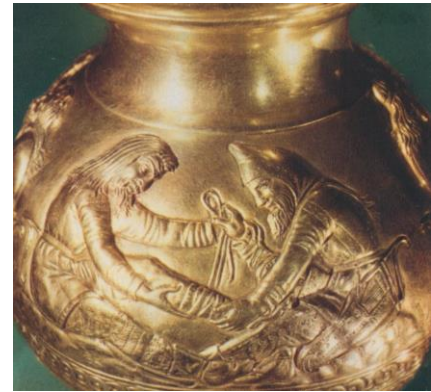
1-resim – Kul – Oba mezarlığındaki 11 Nr.lı kurganından ele geçen altın vazonun üzerinde yer alan yay tasvirleri [3, s. 228]