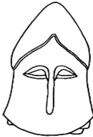
7-resim – Kerch bölgesinden bulunan heykel üzerindeki miğfer tasviri [18, resim 45,5]