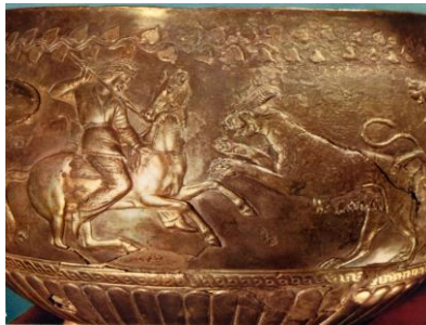
5-resim – Soloha kurganından ele geçen altın kâse [3, s.s. 154-155].