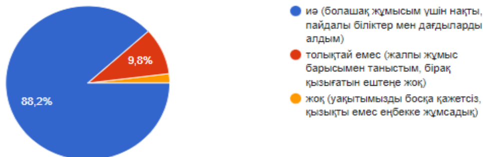
2-сурет – Сауалнаманың 5-сұрағының көрсеткіші

6-сұрақ бойынша респонденттерден білім беру үдерісінің сүйемелдеуін 5 баллдық шкаламен бағалауын сұрадық. Нәтиже төмендегідей: