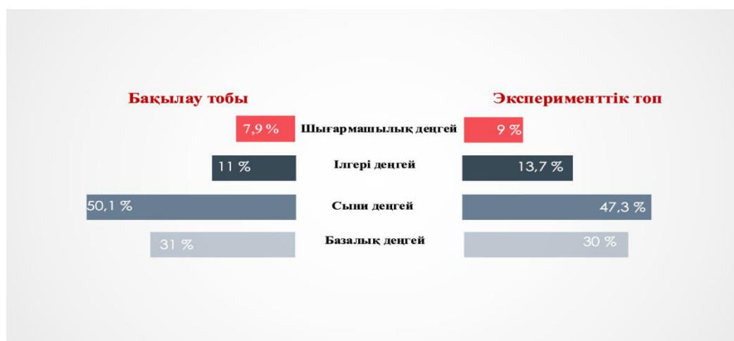
2-сурет – Болашақ бастауыш сынып мұғалімдерінің танымдық компонентінің даму деңгейі

Білім алушылардың жауаптарын талдай келе, олардың өзін-өзі жетілдіруге, өзін-өзі дамытуға деген ұмтылысының бар екендігі көрінді. Алайда, танымдық компонент бойынша берілген жауаптарға назар аударсақ, көптеген білім алушылар оқушылардың әлеуметтік дағдысын дамытуды қалай жүргізу керектігін, неден бастайтынын, ол қандай қызметтерді қамтитынын, қандай әдістерді пайдалану керектігін білмеді. Студенттердің танымдық даму деңгейінің төмен екенін көреміз. Бұл мәліметтердің көрсеткіші төмендегі 2-суретте бейнеленген.