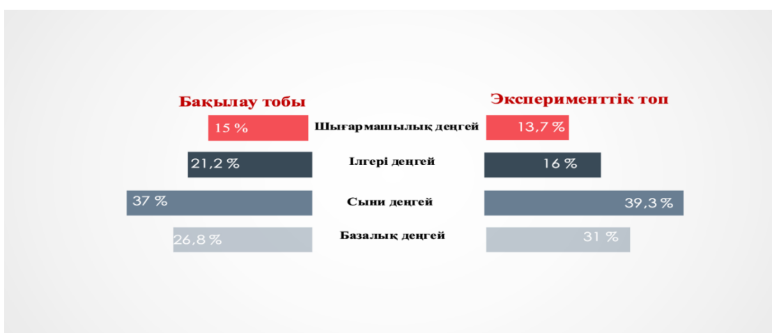
4-сурет – Болашақ бастауыш сынып мұғалімдерінің рефлексивті компонентінің даму деңгейі

Іс-әрекеттік компонентте сыни деңгейінің басым болуы, студенттердің практика барысында интернеттегі дайын материалдарды өндемей пайдаланатындығы, оқу бағдарламаларымен таныс болғанымен, іс-жүзінде сирек пайдаланатындығы анықталды. Мұндай нәтижеден соң сәйкесінше, 4-суретте де төмен деңгей көрсететіндігін байқаймыз.