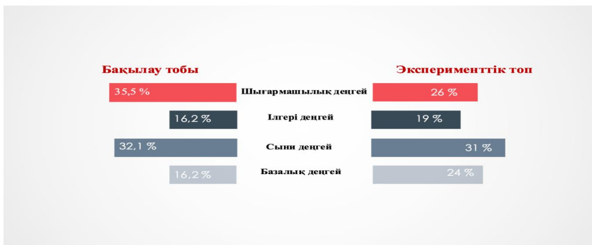
3-сурет – Болашақ бастауыш сынып мұғалімдерінің іс-әрекеттік компонентінің даму деңгейі

Іс-әрекеттік компонентте сыни деңгейінің басым болуы, студенттердің практика барысында интернеттегі дайын материалдарды өндемей пайдаланатындығы, оқу бағдарламаларымен таныс болғанымен, іс-жүзінде сирек пайдаланатындығы анықталды. Мұндай нәтижеден соң сәйкесінше, 4-суретте де төмен деңгей көрсететіндігін байқаймыз.