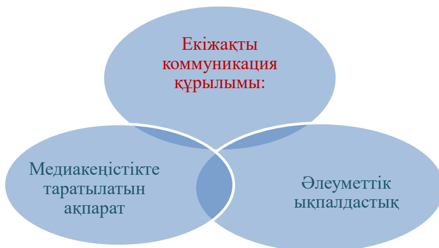
1-сурет – Екіжақты коммуникация құрылымы

Екі жақты қарым-қатынас дегеніміз медиа кеңістігінде кез келген ақпаратты беру ғана емес, сонымен бірге белгілі бір әлеуметтік өзара әрекеттесу, тұлғааралық қатынастарды құру құралы, мұнда жоғарыда айтылғандар да, қабылдау процесі де, кері жауап беру мүмкіндігі де маңызды [5, 71–79-бб.]. Бұл сұхбаттасушының кері жауабы, бүгінде медиа коммуникацияның бесінші және қажетті элементі болып табылады. Қысқаша айтар болсақ төмендегідей (1-сурет):