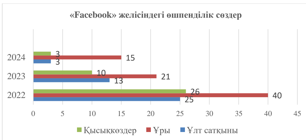
3-сурет – «Facebook» әлеуметтік желісіндегі қолданылатын өшпенділік сөздер

Енді «Facebook» әлеуметтік желісінде біздің елдің тұрғындары қандай өшпенділік сөздерді жиі қолданады деген мәселеге тоқталсақ (3-сурет):