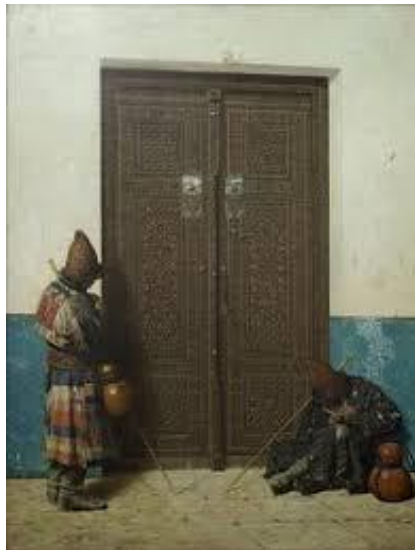
4-сурет – В. Верещагиннің альбомы. XIX ғ. Әзірет Сұлтан кесенесі. Қабырхана есігі

XIX ғ. екінші жартысында жарияланған В.И. Верещагиннің суреті, А.А. Кунның альбомы кесене, оның аумағындағы ескерткіштер туралы мәлімет береді.