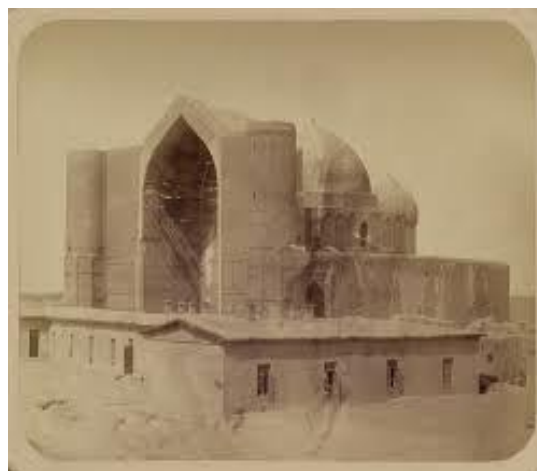
1-сурет. XIX ғ. Әзірет Сұлтан кесенесінің оңтүстік қас беті

Әзірет Сұлтан кесенесінің үлкен бөлмесінде суық кездерде қоқан күзетшілері от жағып, суық түндерде жылынудың салдары сталактиттерге, бөлмелердің сипатына кері әсер етті. Ол кезде қаланың негізгі басты кеңесі қожа шейхул ислам, үш қожа, қала ақсақалдары және қазы болды.