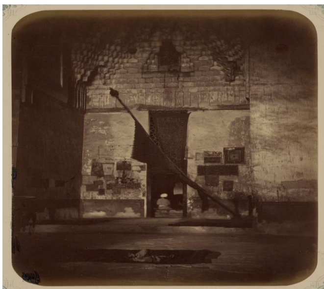
2-сурет. XIX ғ. Әзірет Сұлтан кесенесінің Қазандық бөлмесі. Қабырхана тұсы (Түркістан альбомы)